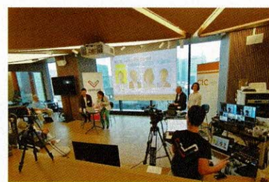
ベンチャーカフェ東京