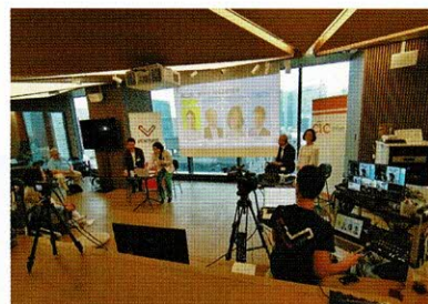
ベンチャーカフェ東京