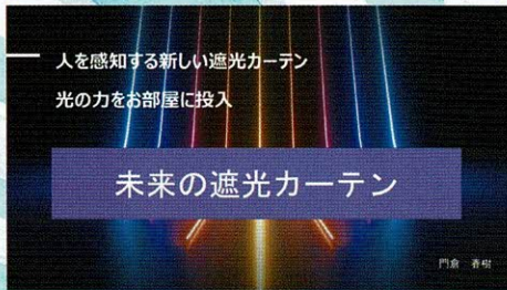
昨年の入賞者の作品