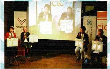
昨年の審査の公開様子